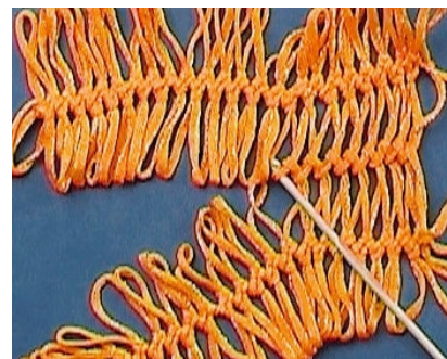
3 - Wird die Häkelnadel beim Verbinden von hinten durch die Schlinge geführt, verdrehen sich die Fäden. Abgebildet ist das Verbinden jeweils einer Schlinge.